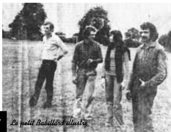
7 Le petit Babillard illustré