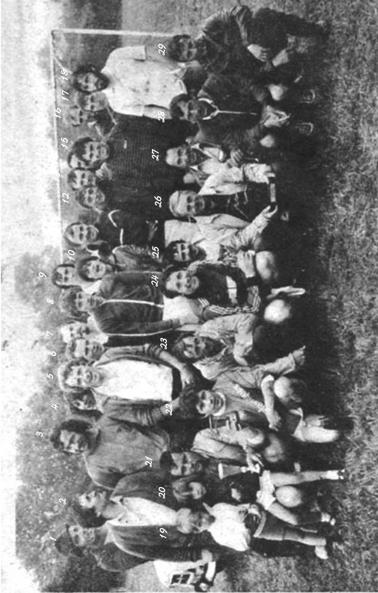
En attendant les prochaines retrouvailles, à la veillée du 2 avril et, pourquoi pas, autour d'un méchoui avant l'été, amusez-vous à retrouver les