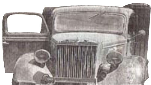
Une « Samson avec malle à l'arrière »